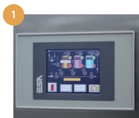
Pannello di controllo. PLC.