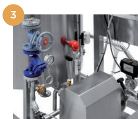
Gruppo di riscaldamento a vapore. Grupo de calentamiento a vapor.