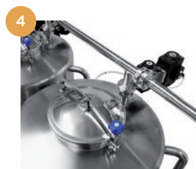
Gestione automatica tramite valvole pneumatiche. Gestión automática mediante válvulas neumáticas.