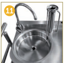
11 PLATO DEGREES CONTROL STATION WITH BASIN PLATOGRAD-KONTROLLSTATION MIT WANNE