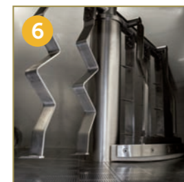
6 REMOVABLE FILTRATION PLATE WITH TRAPEZOIDAL PASSAGE 0,75 - 1,2 MM HERAUSNEHMBARE SEGMENTFILTERPLATTE MIT KEILFÖRMIGEN EINSCHNITTEN 0,75 - 1,2 MM