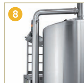
8 BOILING FUMES CONDENSER AND EXTRACTOR KONDENSATOR UND ABSAUGUNG FÜR DIE BEIM SIEDEN ENTSTEHENDEN SCHWADEN