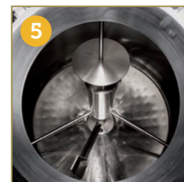
5 VIGOROUS BOILING SYSTEM WITH INTERNAL TUBULAR HEATER LEISTUNGSSTARKES SIEDESYSTEM MIT HINTEN LIEGENDEM ROHRERHITZER