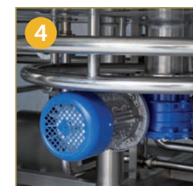
4 BOTTOM OF LAUTER TUN WITH 5 OUTLETS BODEN DES LAUTERBOTTICHS MIT 5 AUSTRITTSÖFFNUNGEN