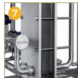
7 ONE AND TWO STAGE COOLING WITH HIGH THERMAL EFFICIENCY AUSGESPROCHEN WÄRMEEFFIZIENTE, EIN- ODER ZWEISTUFIGE KÜHLUNG