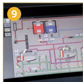
9 PLC FOR AUTOMATIC CONTROL OF THE PRODUCTION PROCESS AND RECIPE MEMORIZATION SPS FÜR DIE AUTOMATISCHE PRODUKTIONSPROZESSSTEUERUNG UND REZEPTSPEICHERUNG