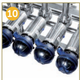
10 PNEUMATIC VALVES GROUP BLOCK AUS LEBENSMITTELGERECHTEN DRUCKLUFTVENTILEN