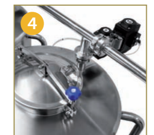
GESTIONE AUTOMATICA TRAMITE VALVOLE PNEUMATICHE GESTIÓN AUTOMÁTICA MEDIANTE VÁLVULAS NEUMÁTICAS