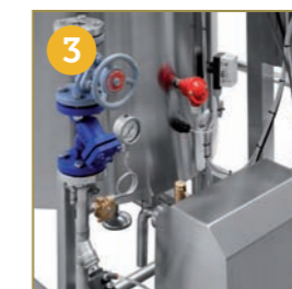
GRUPPO DI RISCALDAMENTO A VAPORE GRUPO DE CALENTAMIENTO A VAPOR